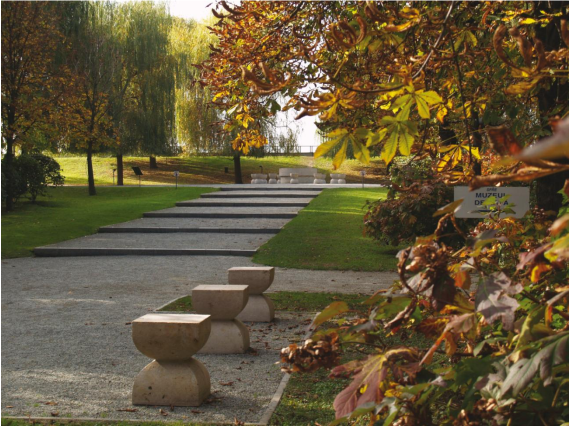
L'Allée des chaises