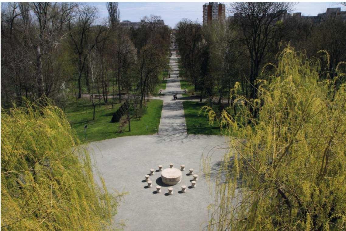
Vue de l'axe conceptuel, la Table du silence en premier plan