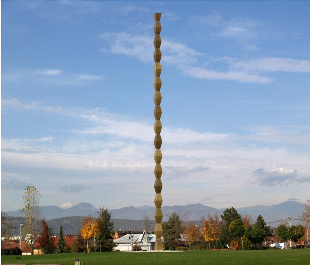
Colonne sans fin