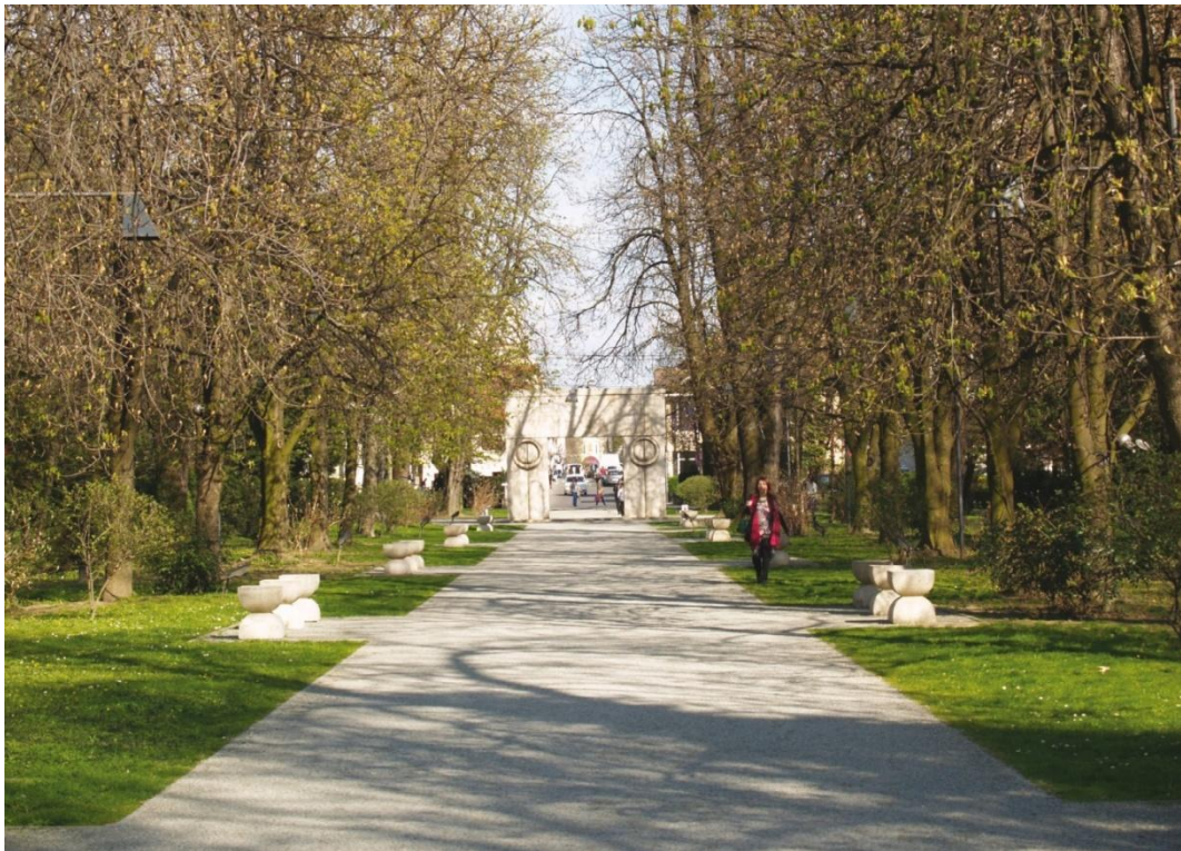
Vue de l'axe conceptuel, l'Allée des chaises et la Porte du baiser